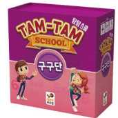
탐탐 스쿨 구구단

Frederique Costantini Christopher Matt www.happybaobab.com