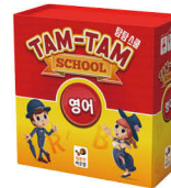
탐탐 스쿨 영어