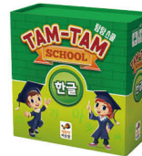
탐탐 스쿨 한글