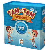
탐탐 스쿨 덧셈