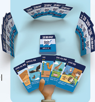
<4인 게임 준비 예시>

3 나눠주고 남은 카드는, 한 더미를 만들어 뒷면이 보이게 테이블 중앙에 놓습니다.