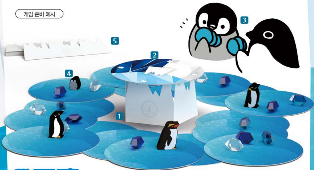
게임 준비 예시