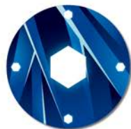
미션 내용이 같은 경우