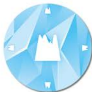
배경색이 같은 경우

지금 펠트하우스 맨 위에 있는 카드와 배경색 또는 미션 내용이 같은 카드만 펠트하우스에 올려놓을 수 있습니다.