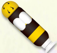
꿀벌 스틱 4개