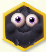
보너스 타일 10개