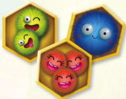
꽃가루 타일 54개