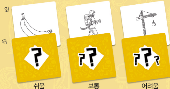
그림 카드 240장