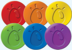
달걀 36개 (6가지 색, 색별로 6개씩)