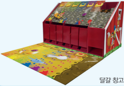
달걀 창고 1개