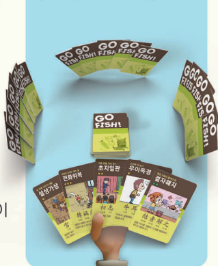
<4인 게임 준비 예시>

3 나눠주고 남은 카드는, 한 더미를 만들어 뒷면이 보이게 테이블 중앙에 놓습니다.